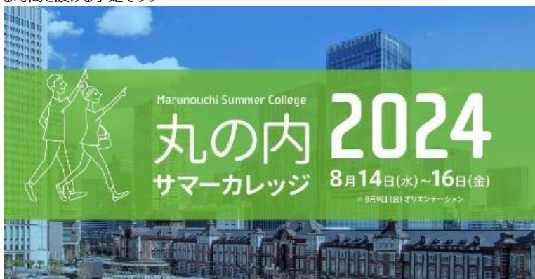
「丸の内サマーカレッジ 2024」キービジュアル

※14日休憩時間（12:00～13:00、15:00～15:30）の一部及びメインプログラム終了後（17:30以降）に、質疑応答や参加者の声をご取材いただける時間を設ける予定です。